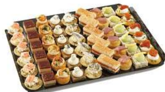
Petits fours Tradition 54 pièces 44,90 €