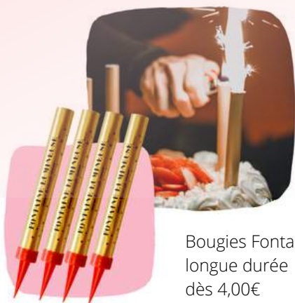
Bougies Fontaines longue durée dès 4,00€