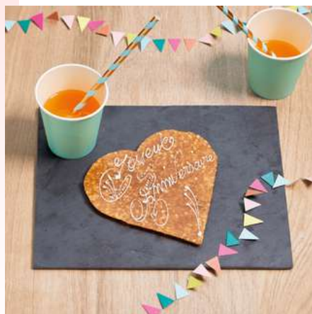
Plaques Nougatine à personnaliser dès 7,90 €

Découvrez dans nos boutiques une gamme variée d'accessoires, pour décorer vos desserts, et les rendre uniques.