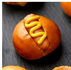
Mini Hot-Dogs 15 pièces 14,90 €