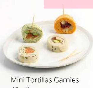
Mini Tortillas Garnies 48 pièces 34,90 €