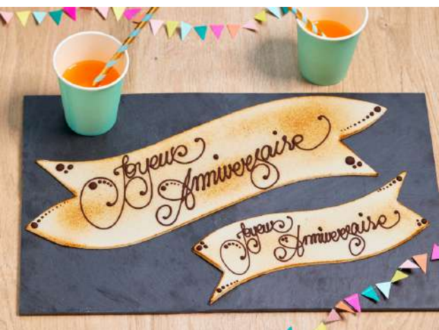
Plaques en pâte d'amande à personnaliser dès 7,90 €