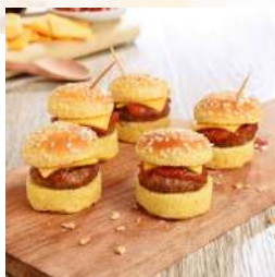
Mini Burgers 20 pièces 19,90€

Parce que les apéritifs ou cocktails dinatoires sont aujourd'hui très tendances, optez pour un cocktail salé signé La Romainville.