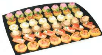
Plateau Végétarien 54 pièces 44,90 €

Des mini burgers aux mini tortillas en passant par nos petits fours tradition, La Romainville vous offre un large choix pour composer votre buffet.