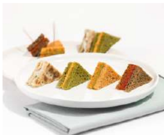
Mini Club-Sandwichs 20 pièces 29,90 €