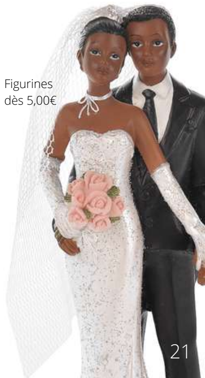
Figurines dès 5,00€